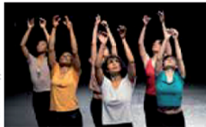
De fugues... en suites