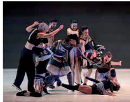
CARCAÇA